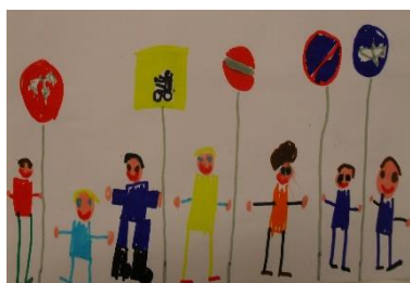
Questo foto di Antonio